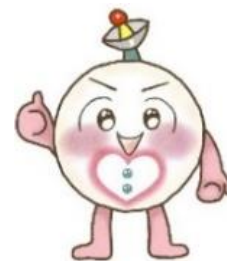
多摩市在住のイラストボランティアのタマボロ君です。