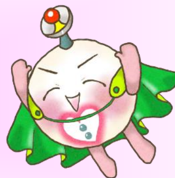
多摩市在住のイラストボラ栗さんの タマボラ君です。