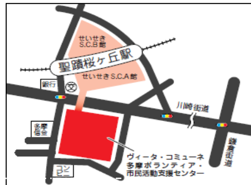
【災害ボランティア講座会場】