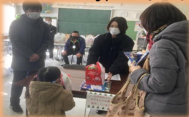
※写真は令和3年度の配布の様子です