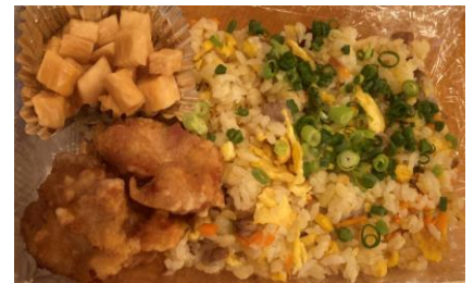
↑すべて手作りのチャーハン+唐揚げ+お漬物です。