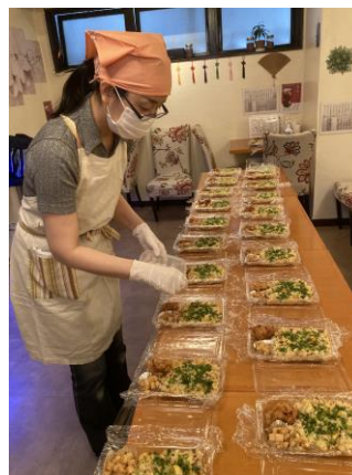
←パッキングはボランティアの方が大活躍