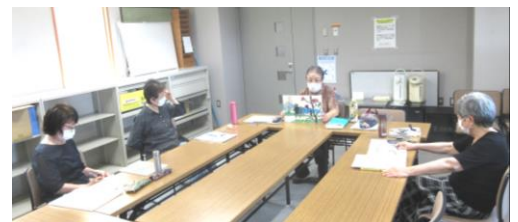
絵本は自前のコレクションや図書館から選びます

今後のやってみたいことは？「多摩市以外の読み聞かせ団体との交流会ができればいいわね～」「大学生の読み聞かせサークルと語り合うこともやってみたいわね」と。想いを実現できますように。