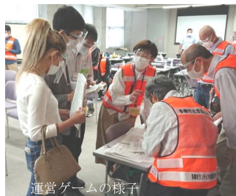
運営ゲームの様子