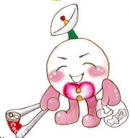
多摩市在住 イラストボラ 雫さんの タマボラ君です