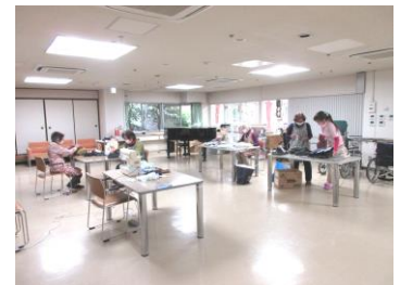
利用者さんと別室で常に換気をしながら活動しています

和光園には「友和会」という裁縫ボランティアの会があり、何十年という長い歴史があります。友和会の皆さんは「ここに来て皆に会えるのが嬉しい。毎回来るのが楽しいの。」と口を揃えて仰っていました。20年近くボラ活動をされている方もおり、腕前はプロ並み。おそろいのエプロンはもちろん手作りです！