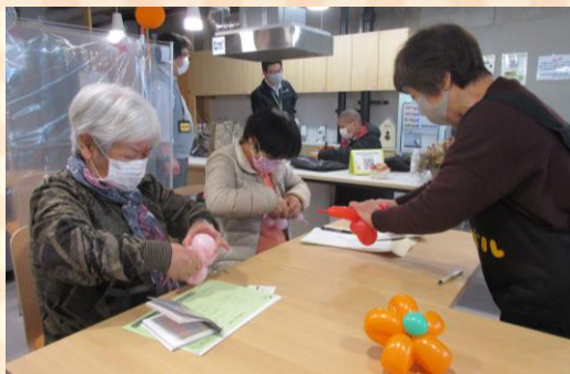
バルーンアートは、鬼滅の刃効果で子供たちに「剣」が大人気！「花」の作り方も教わりました。