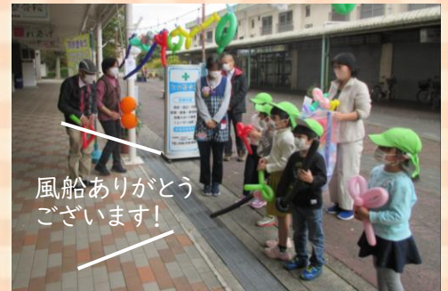
風船ありがとうございます！

URの豊ヶ丘・貝取団地の豊ヶ丘商店街(4-2-5 棟1階)に「居宅介護支援事業所」と併設して、「健幸つながるひろば とよよん」がオープンして3カ月。開所日には、さまざまなイベントが開催され、少しずつ顔なじみの方も増えてまいりました。