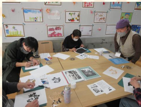
もみじをテーマにした切り絵講座。みんな初めての参加でしたが、全集中！で完成しました。