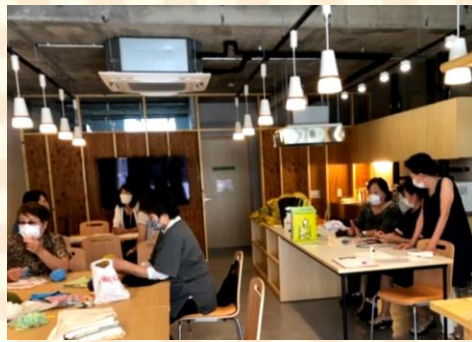
カフェ風の素敵な内装です。

暮らしのちょっとした困りごとなどの相談に応じる他、地域活動や健幸に関する情報の紹介、多世代が参加できるイベントや企画を開催していきます。