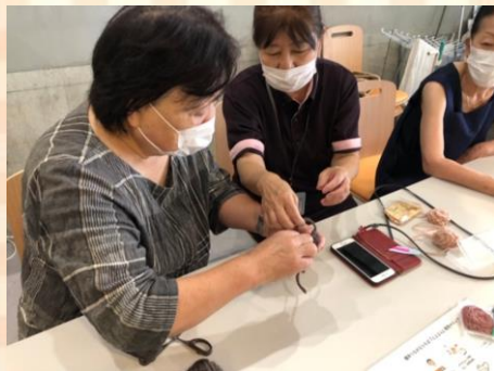
「手作りちくちく」。毛糸のブローチを作りました。