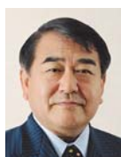
寺島 実郎 Jitsuro TERASHIMA