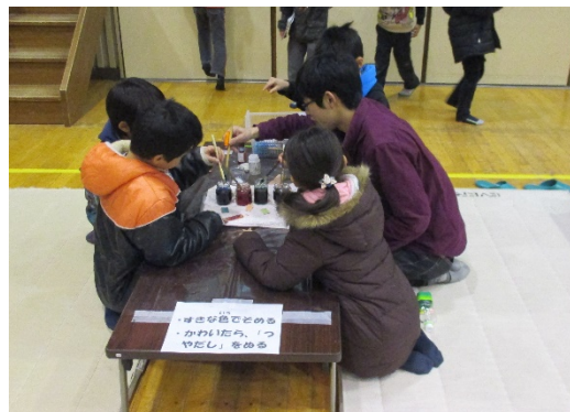
移動児童館でのボランティアの様子

こうした活動を通じて、地域の「お兄さん、お姉さん」として、子供たちの安全・安心の確保と健やかな成長に貢献していきます。