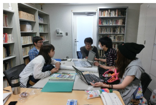
ハイブリッドメディア研究会 企画・編集会議の様子

多摩ニュータウン地域を中心とした地域の情報を地域内外に発信し、地域活性化につなげていくとともに、取材を通じて地域との連携を深め、コミュニケーション力、地域が抱える問題への気づきなど実践的な学習の機会としていきます。