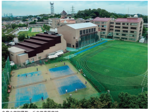
多摩大学附属聖ヶ丘中学高等学校

中学校では、英語・数学・国語を中心に基礎学力の定着を図るとともに、理科では充実した実験設備を活用した実験を多く行い、社会では社会科学として実際に校外へ出かけるなど、生徒の興味・関心を育てる学習を展開しています。本物に触れる体験を重視した教育を通して、学ぶ意欲と確かな理解を養います。こうした学びを土台として、高校では高校1・2年次を中心に探究活動に取り組み、多摩市と連携したゼミ形式の学習を通して、地域の課題に向き合い、考え、発信する力を育て、大学での学びへとつなげています。