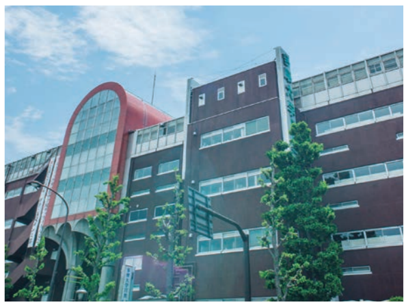
多摩大学目黒中学校・高等学校

進学重視の中高6年一貫校。高校2年からは文系・理系のコース制となります。各コースでは、志望大学への全員合格を目指し、きめ細かい指導と独自のカリキュラムを実施し、実力アップをはかっています。マルチメディア時代にふさわしい教育内容の充実・向上を目指しています。横浜のセミナーハウスには研修室を備えた体育館、広いグラウンドが整備され、野球部、サッカー部等の生徒が汗を流しています。