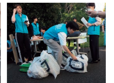
藤沢市との連携【ぶらりごみ拾い】