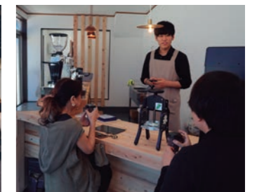
奥多摩町との連携【奥多摩AUBAコーヒーショップ】