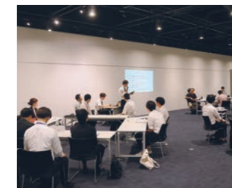
多摩市・稲城市・八王子市・日野市・町田市・京王観光株式会社との連携【タマリズムマッチング会】