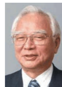
情報社会学研究所 所長 公文 俊平 KUMON Shumpei https://www.ni.tama.ac.jp/

近年叫ばれる医療や介護をめぐる諸問題に対して、経営学や経済学、あるいは前研究所からのノウハウであるリスクマネジメントといった手法を用いて解決手段を探ることを目的とし、活動しています。