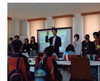
小田急不動産株式会社との連携【マチカドこども大学®】