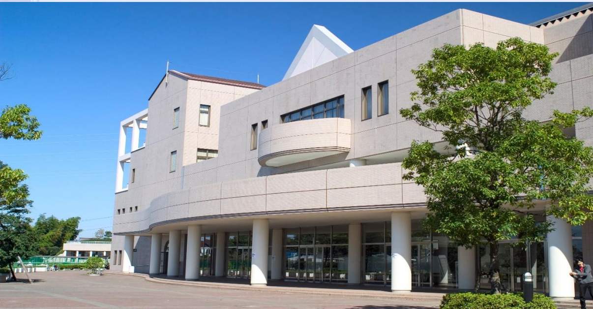
多摩キャンパス(経営情報学部)