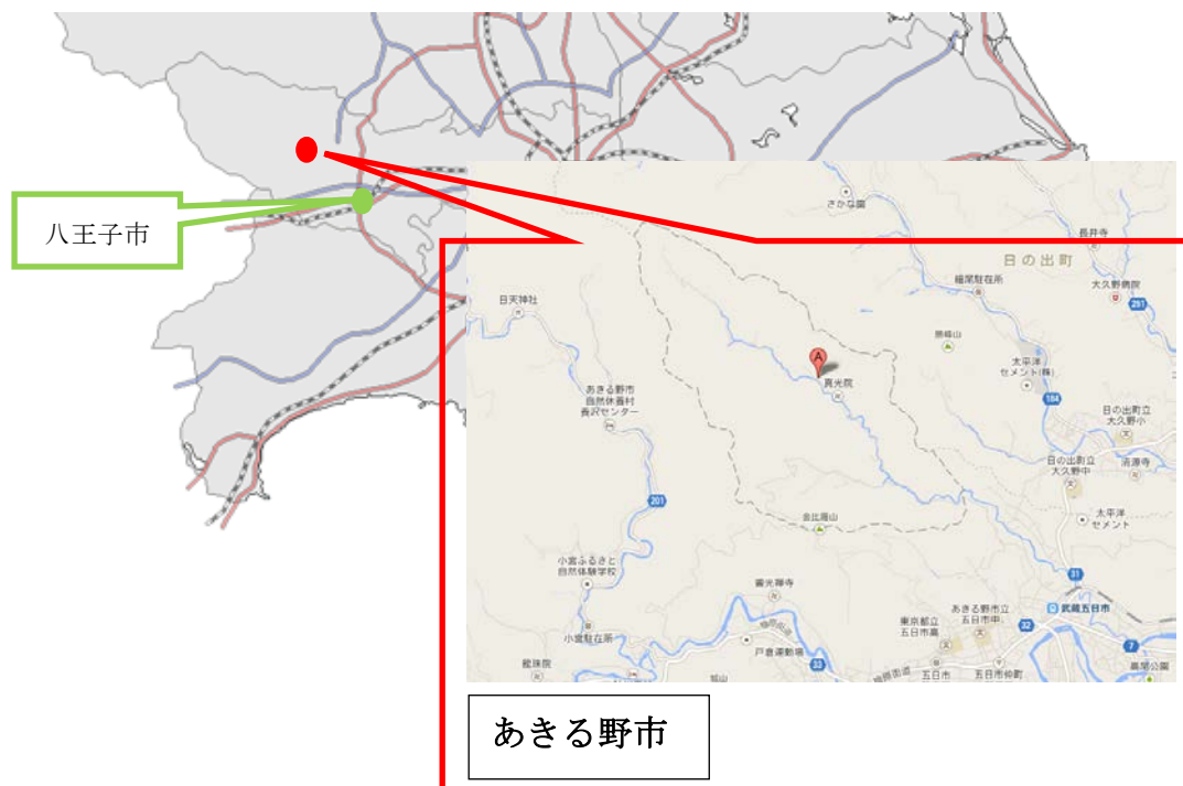
図表 3-3 深沢家の立地と地図 (点線囲いは現在のあきる野市深沢)