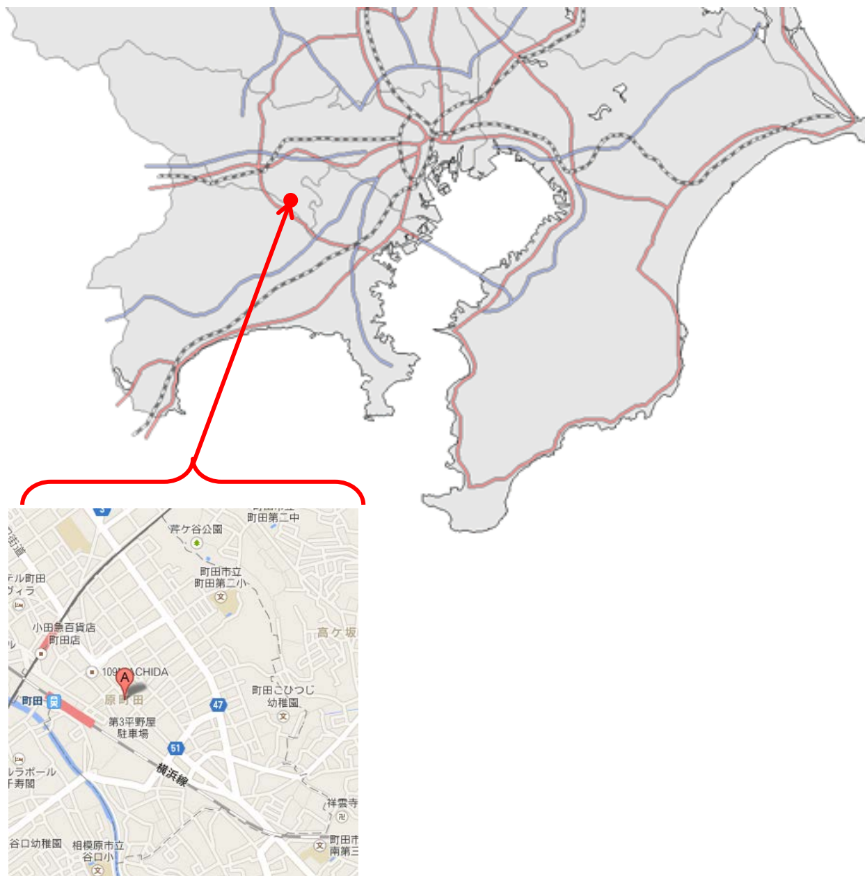
図表 4-1 原町田の地図

の豪農であった昌吉のもとで育ち、名主としての指導を受け、村の区長を務めるほどの指導力と資産を持っていた。また、彼は幼い頃から人を引き寄せるカリスマ性を兼ね備えていたと共に、自由奔放に育ったとはいえ義父の昌吉から「質素さ、つつましさ、厳しさ」を肌で感じながら育ってきたのではないだろうか。