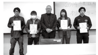
学長賞、社会・研究活動賞 (3 年生)