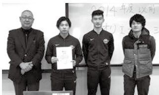
学長賞 (フットサル部)