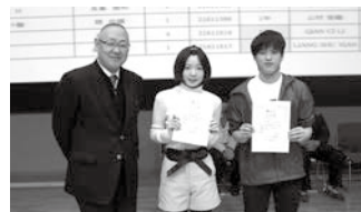
社会・研究活動賞 (1 年生)