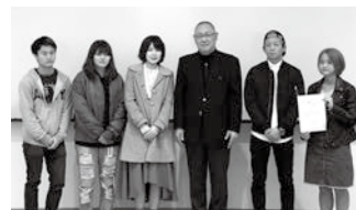
社会・研究活動賞 (2 年生)