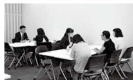
保証人様と教職員との個別相談