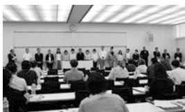
定期総会にて役員に選出された皆様

個別相談終了後、カフェテリアにて懇親会を行い、保証人の皆様と教職員が和やかに歓談し交流を深めました。