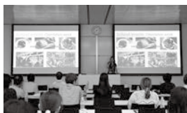
海外留学体験を発表する学生