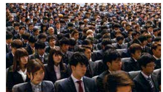
入学式に臨む新入生たち