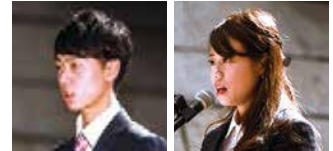
経営情報学部(左)、グローバルスタディーズ学部(右)の新入生代表