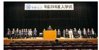
経営情報学部 保護者向け説明会