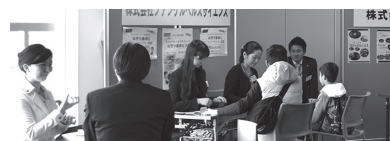
「健康まちづくり産業」展示会