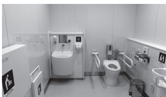
101教室前 誰でもトイレ