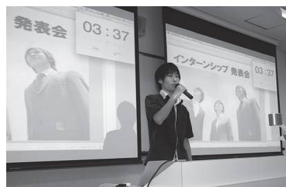
グループの代表者が全員の前で発表