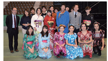
伝統的衣装を着用して留学生と国際交流