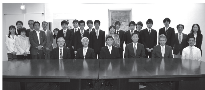
卒業生、保護者の皆様と教職員

式終了後は卒業パーティーが行われ、卒業生、保護者、教職員が歓談し別れのひとときを和やかに過ごしました。