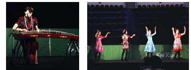
伝統的衣装によるファッションショーや楽器演奏、ダンスなどが披露されました。