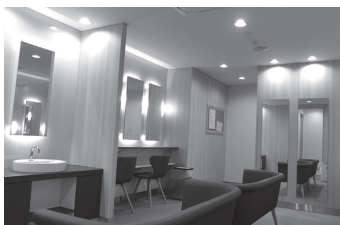
女子リフレッシュルーム