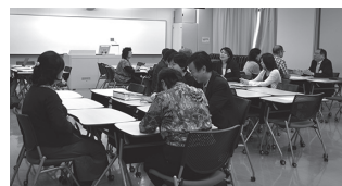
保護者の方とゼミ担当教員が懇談