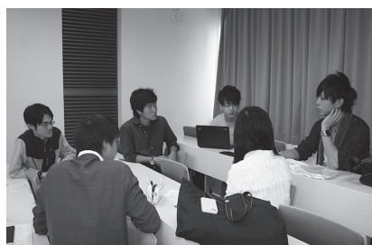
代表者を決め発表の内容を話し合い