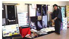
着物会社に就職した多摩大学卒業生