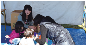
輪投げ・スーパーボール投げ・ヨーヨー釣り・的あて