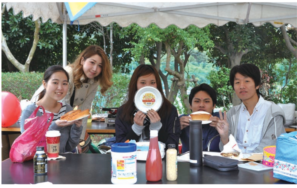
1年生のAEP (Academic English Program) クラスの屋台。A2クラスはホットドッグを販売