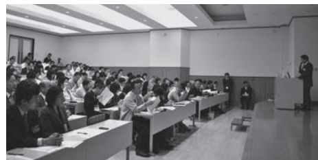
セミナーには多くの保護者の皆様に参加

3・4年生の保護者の方々を対象にゼミ担当教員がゼミの活動状況などを懇談会・個別相談形式でお伝えし、1・2年生の保護者の方々には職員による個別相談会を実施しました。