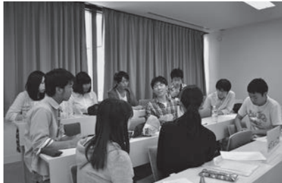
グループごとにディスカッション