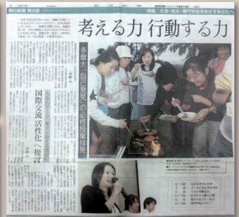
「自己発見」について紹介した2003年10月12日朝日新聞の大学特集記事