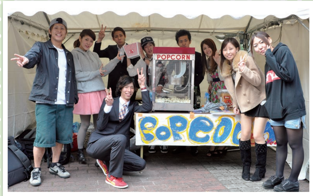
ダンスサークル TDC の模擬店ではポップコーンを販売