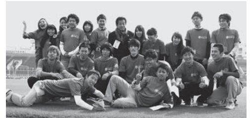
ピッチでの集合写真

私たちが主催したイベントは、大きく体験・応援・グッズに分けることができる。唯一の体験イベントである「サッカー射的」は小さな子供に大変人気であった。お祭りでは定番の射的の要領で行うシンプルな体験型イベントであった。応援型のイベントは「応援Tシャツ」と「モザイクアート」を行い、サポーターの方々に好評で、多くの方がこの作品の前で記念撮影を行った。グッズ型のイベントは昔懐かしの「プラバン」「ビーズアクセ」も人気で、親子で楽しんでいる姿を多く見ることができた。毎年定番の横浜FCのロゴとマ