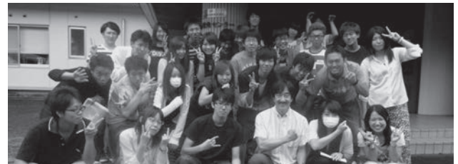
4泊5日の合宿を終えての集合写真

今回、夏合宿リーダーを務めさせていただいて、リーダーというものがいかに大変かということを知ることのできる機会となりました。そして、周りのゼミ生の協力のお陰で無事に合宿を終えることができ、ゼミ生がさらに大好きになりました。また、合宿ではそれぞれ学年に分かれ