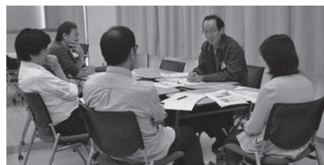
ゼミ担当教員との懇談会