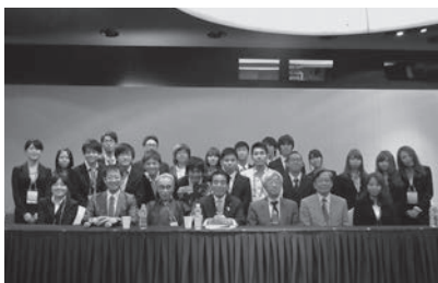
下村博文文部科学大臣と多摩大生との記念写真

5月30日～6月1日、学生・教職員26名が韓国済州島にて開催の「済州平和フォーラム2013(5月29日～31日)」に参加しました。世界貢献のための日韓協力と日本の科学技術の情報発信を図るべく本学が企画したセッション「アジアの連帯協力と新事業新技術が世界を救う」では、下村博文文部科学大臣が基調講演を行いました。伝説の投資家ジム・ロジャースの特別講演やAFLAC最高顧問大竹美喜氏、元首相鳩山由紀夫氏との交流の機会もあり、47カ国3665人が参加したアジアの未来と発展を論じるフォーラムへの参加は、アジアダイナミズムの最前線を体感する貴重な経験となりました。