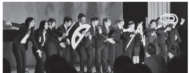
チームで作り上げた演出でプレゼンテーション

3年生を対象としたキャリア支援講座では、筆記試験や面接対策講座など様々なプログラムを開催しています。中でもプロのミュージカル劇団「音楽座ミュージカル/Rカンパニー」による「YOKUBA」は、自己表現力の向上と達成感の体感を目的に導入された多摩大独自のプログラムで、今年で2年目となります。このプログラムの最終回(第7回目)として、12月11日(水)16時30分～18時30分多摩キャンパス001教室にて「出陣式」が開催されました。今回のテーマは「なりきりシスター!～君だったらどうする?～」。課題は、新社長になりきって社員を安心させ元気づける就任スピーチを考え発表すること。学生たちはグループごとに舞台の上で、思い思いのことばや身振りで表現しました。終盤には先生方からの応援メッセージが映像で流れ、就職活動に向う学生たちを激励しました。