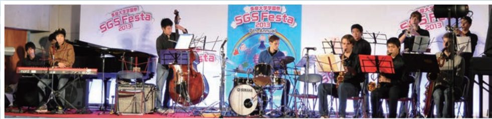
アメリカンスクール・イン・ジャパンによる吹奏楽コンサート