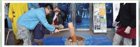
福島支援～道の駅ひらた～もちつきと東北物産展