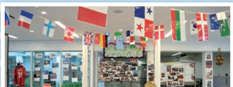
Study Abroad Café 留学カフェで世界を旅しよう! 留学先の写真、手作りのお菓子、コーヒー、紅茶で会話