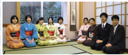
茶道部は男女13名のサークル