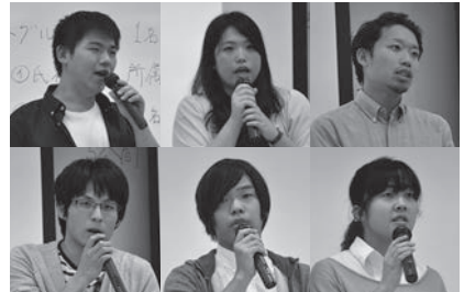
壇上で体験や感想を発表する学生