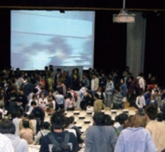
「自己発見」講義風景